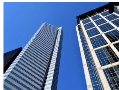
Ayudas para la eficiencia energética