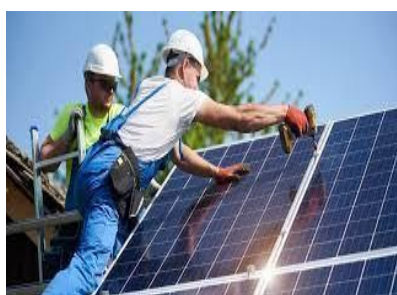
Ayudas al autoconsumo, almacenamiento