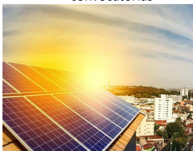
Ayudas para la transición energética