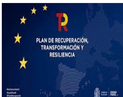
Calendario de próximas convocatorias