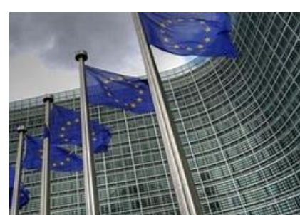
Plan de Recuperación, transformación y Resiliencia