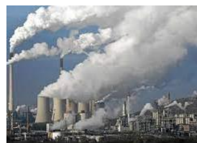
Compensación de costes emisiones indirectas