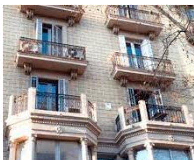
Ayudas a la Rehabilitación de viviendas