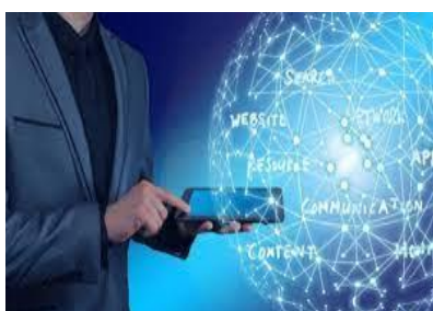
Programa de Misiones de Ciencia e Innovación