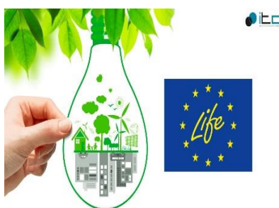
Programa LIFE de la Unión Europea