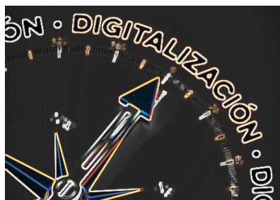
Línea Directa de Innovación