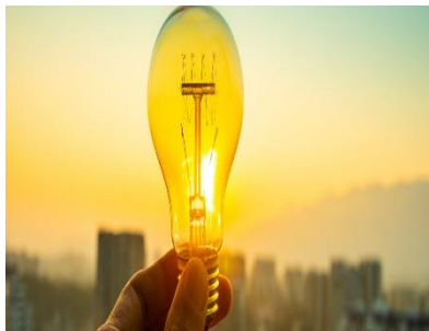
Ayudas eficiencia energética