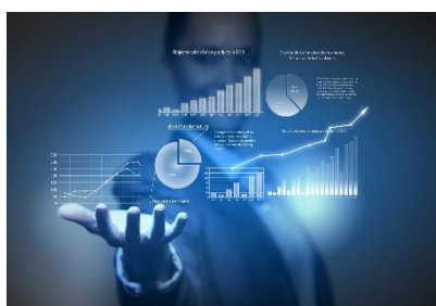
Programa Kit Digital