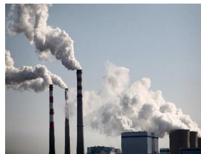
Régimen de ayudas para empresas de alto consumo de energía