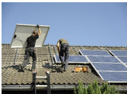
Programa de incentivos para energías renovables